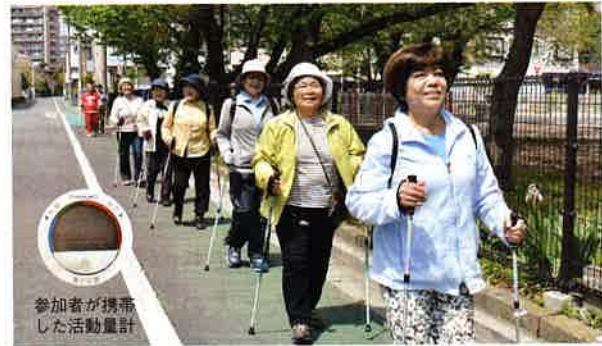
参加者が携帯した活動量計