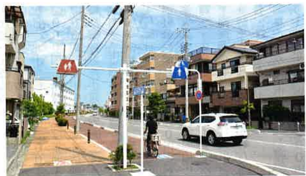
整備が行われたわらびりんご通り