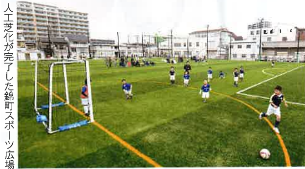
人工芝化が完了した錦町スポーツ広場